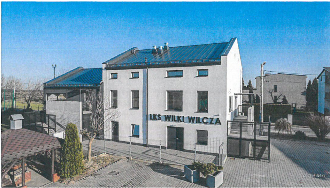
Budynek przy ul. Grzonki 13a